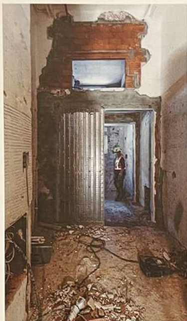
Fase di demolizione e ricostruzione delle partizioni interne per l'adeguamento funzionale-spaziale e degli impianti