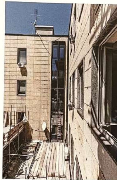
Vista dall'alto dello stato di facciata prima delle opere di pulizia e di mascheramento delle unità esterne di climatizzazione

Top view of the façade before the cleaning and masking works of the external air conditioning units