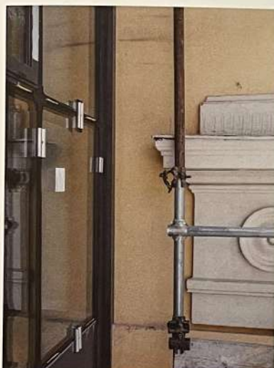
Immagini di dettaglio della posa della facciata vetrata Detail images of the installation of the glazed façade

View of the new continuous corner glazed window built overlooking the inner courtyard