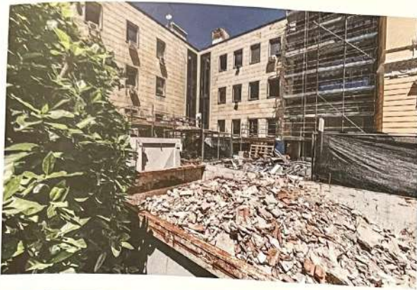
Fasi di cantiere con l'allestimento del ponteggio per la sostituzione della facciata vetrata continua

Construction site stages with scaffolding set up for replacing the continuous glazed window