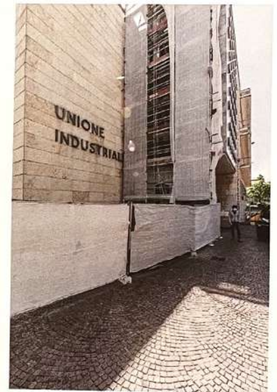
Vista dell'ingresso dell'edificio, tra via Fanti e via Vela, durante le opere di cantiere

Top view of the façade before the cleaning and masking works of the external air conditioning units