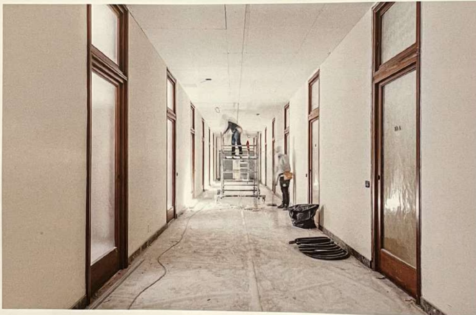
Opere di controsoffittatura del lungo corridoio distributivo nei vari piani

LOCATION: Torino YEAR: 2021 TYPE: competition - winning project CLIENT: Unione Industriali Torino AREA: 3,060 m 2 PROJECT: arch. Matteo Italia - Italia+Partners TEAM: arch. Matteo Italia, arch. Vincenzo Italia, arch. Carolina De Lucia, arch. Emilio Pantò, arch. Camilla Chaverra, arch. Gisele Chauvet WORKS MANAGEMENT: arch. Matteo Italia STRUCTURAL PROJECT: ing. Mirko De Viti BUILDING COMPANY: ICZ spa Gruppo Intercostruzioni FAÇADES: Frea&Frea srl